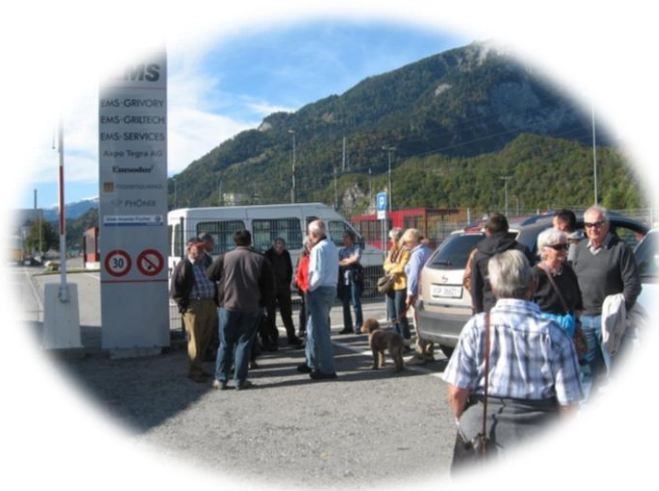
2013 (½Tag) EMS-Werk mit Ausstellung zum 75-Jahrjubiläum

Ein Reisebericht 2020 gibt es somit nicht. Dafür ein fotografischer Überblick der Ausflüge in den vergangenen Jahren. Hoffen wir, dass 2021 der geplante Ausflug nachgeholt werden kann.