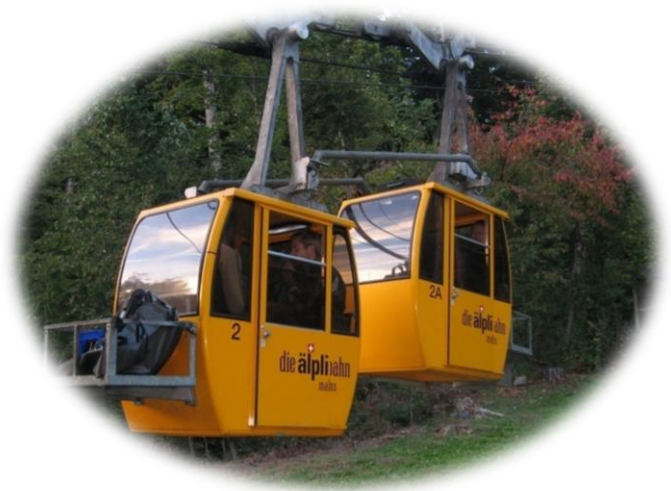
mit der Älplibahn hoch zum Restaurant zum Nachtessen