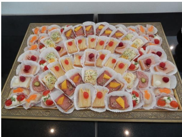
Ein Kunstwerk aus der Küche und es fiel schwer "nur" 4 Stück pro Person zu genießen